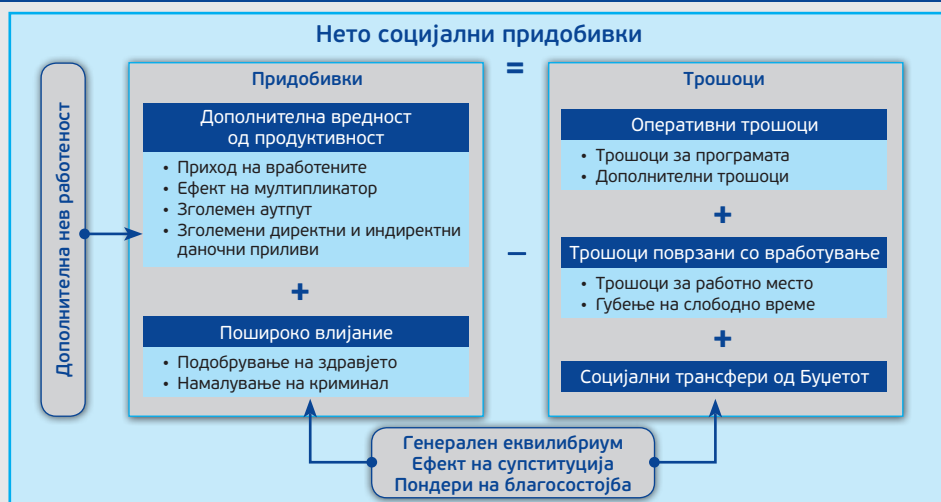
Графички приказ 3. Социјален аспект на анализата за трошоци и за придобивки

Мерката на субвенционирано вработување на лица до 29 години има негативен резултат на другите категории невработени лица истиснувајќи ги од конкурентните можности за наоѓање работа под исти услови. Ова е делумно неутрализирано со вклучување на субвенционирано вработување и на другите возрасни групи.